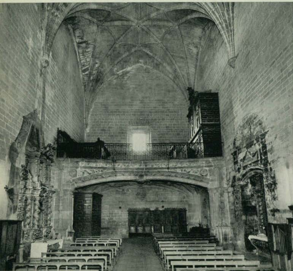
197 - LEZA. - Interior del templo, visto desde la cabecera.