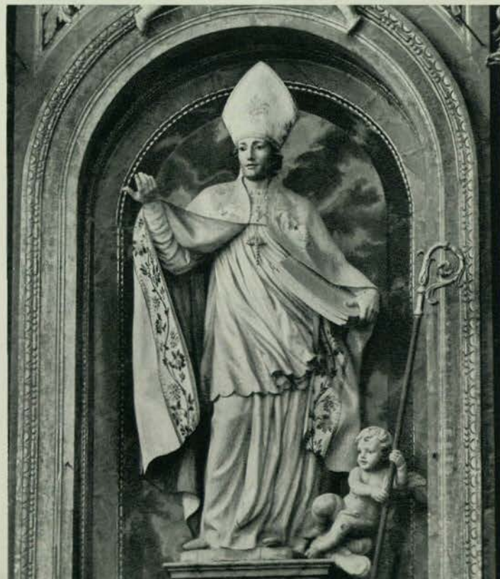
194 - LEZA. - San Martín en el retablo mayor.