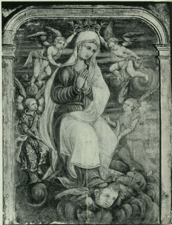
191 - LEZA. - Tabla de principios del XVI.