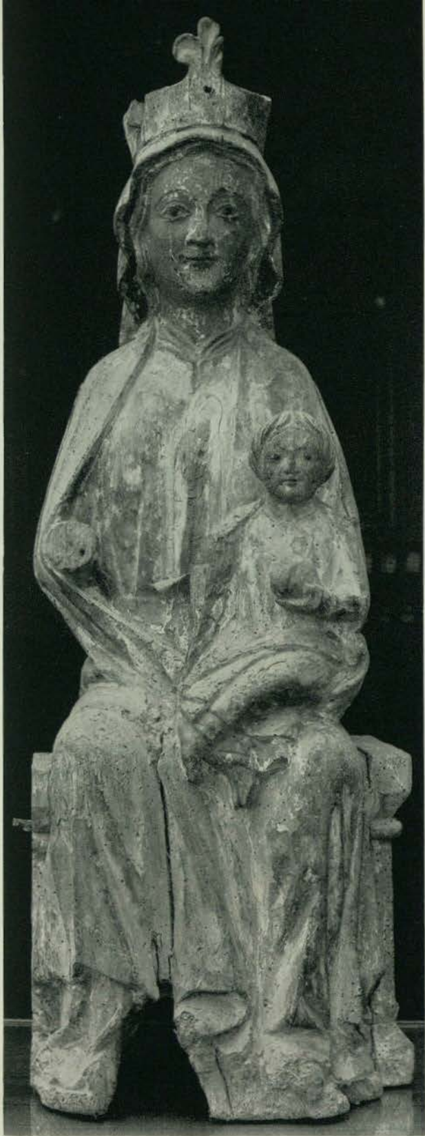
192 - LEZA. - Santa María de Leza.