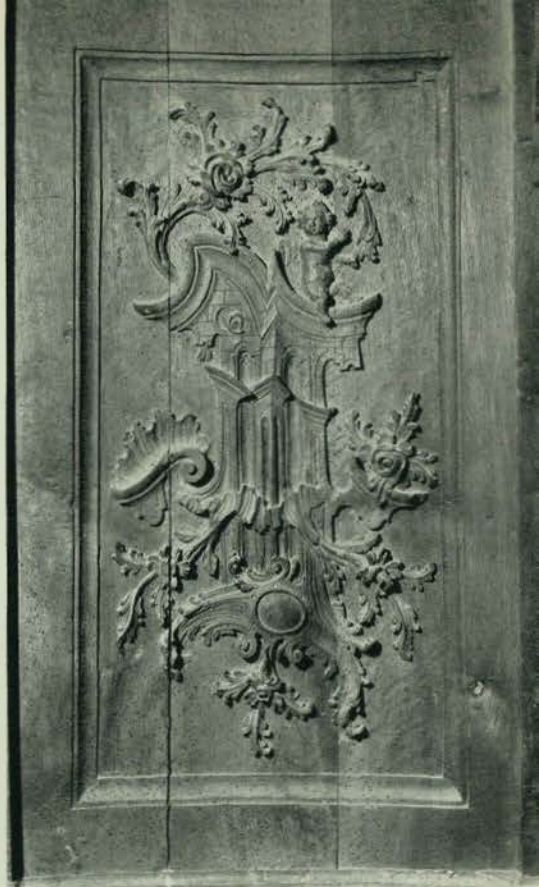
195 y 196 - LEZA. - Sillería coral.